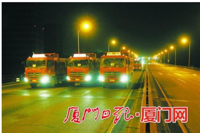
多辆车根据测点摆放，进行静载试验。

厦门网-厦门日报讯（记者 徐景明）海沧大桥“体检”工作正式开展。6日凌晨，厦门路桥已对大桥进行线形测量，今日凌晨则启动了承载力荷载试验。